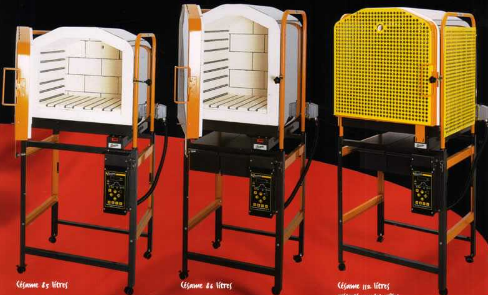
Césame 85 litres